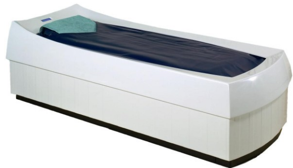
Revêtement de design

peut être aperçue et entendue. L'eau transmet les vibrations du massage acoustique sur le film plastique et sur le client avec une intensité impressionnante.